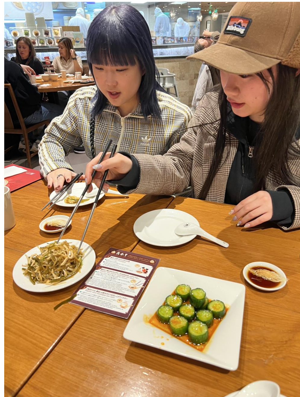
台北到着初日（2月17日）に109ビルの小籠包専門レストランで夕食