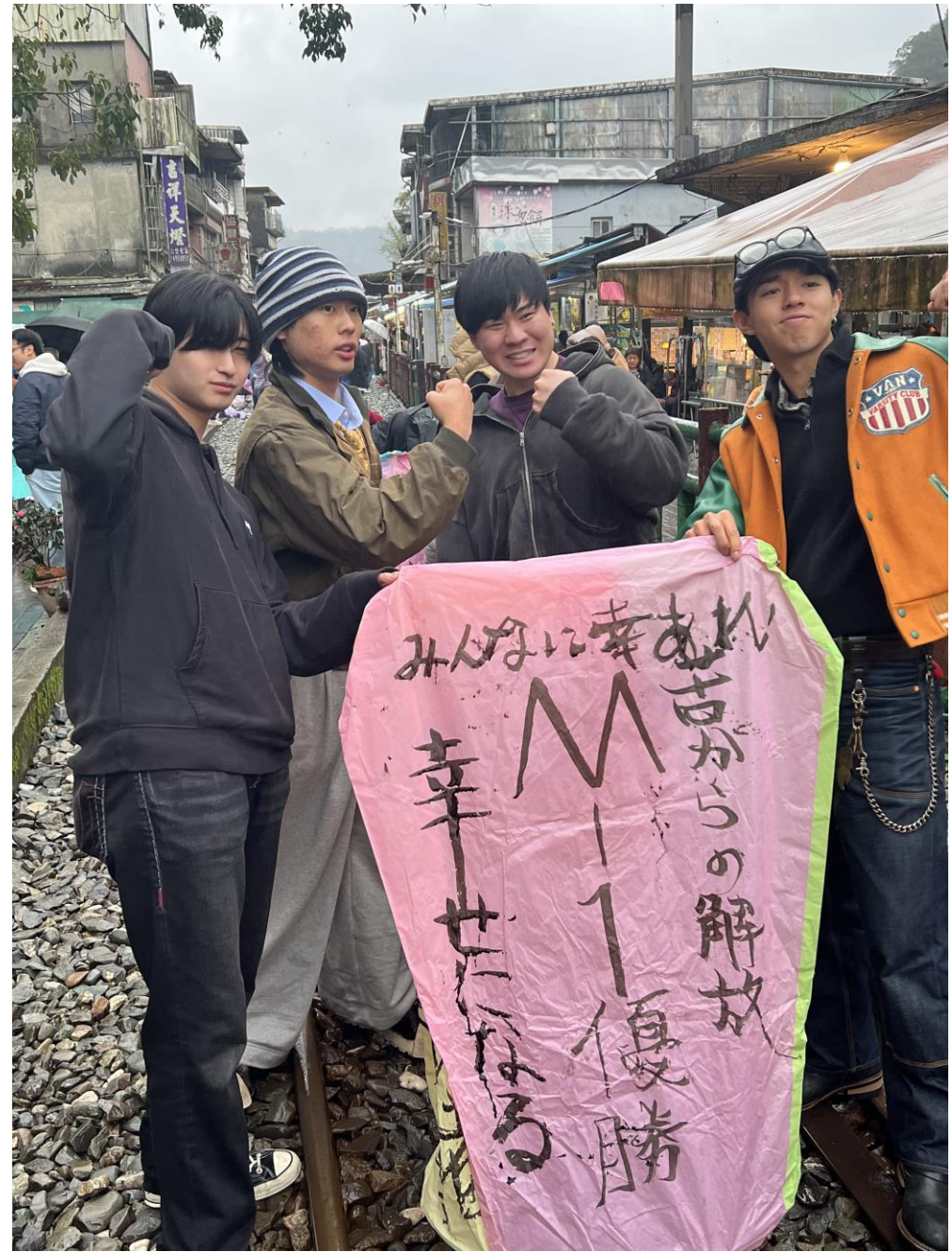
十分でランタン飛ばしに挑戦（2月18日）