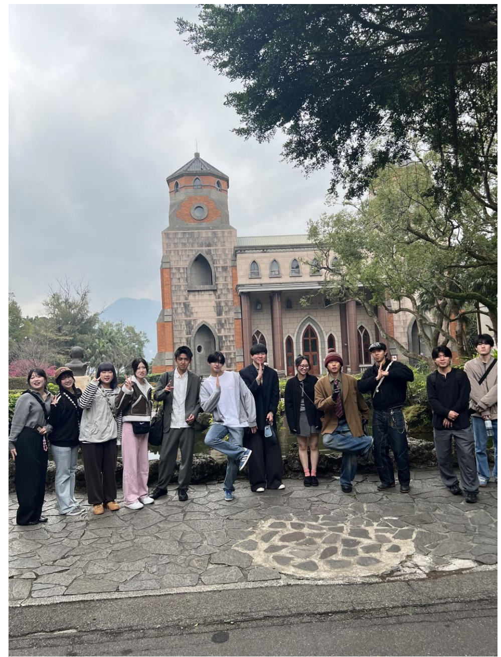
台灣真理大學訪問（2月20日）