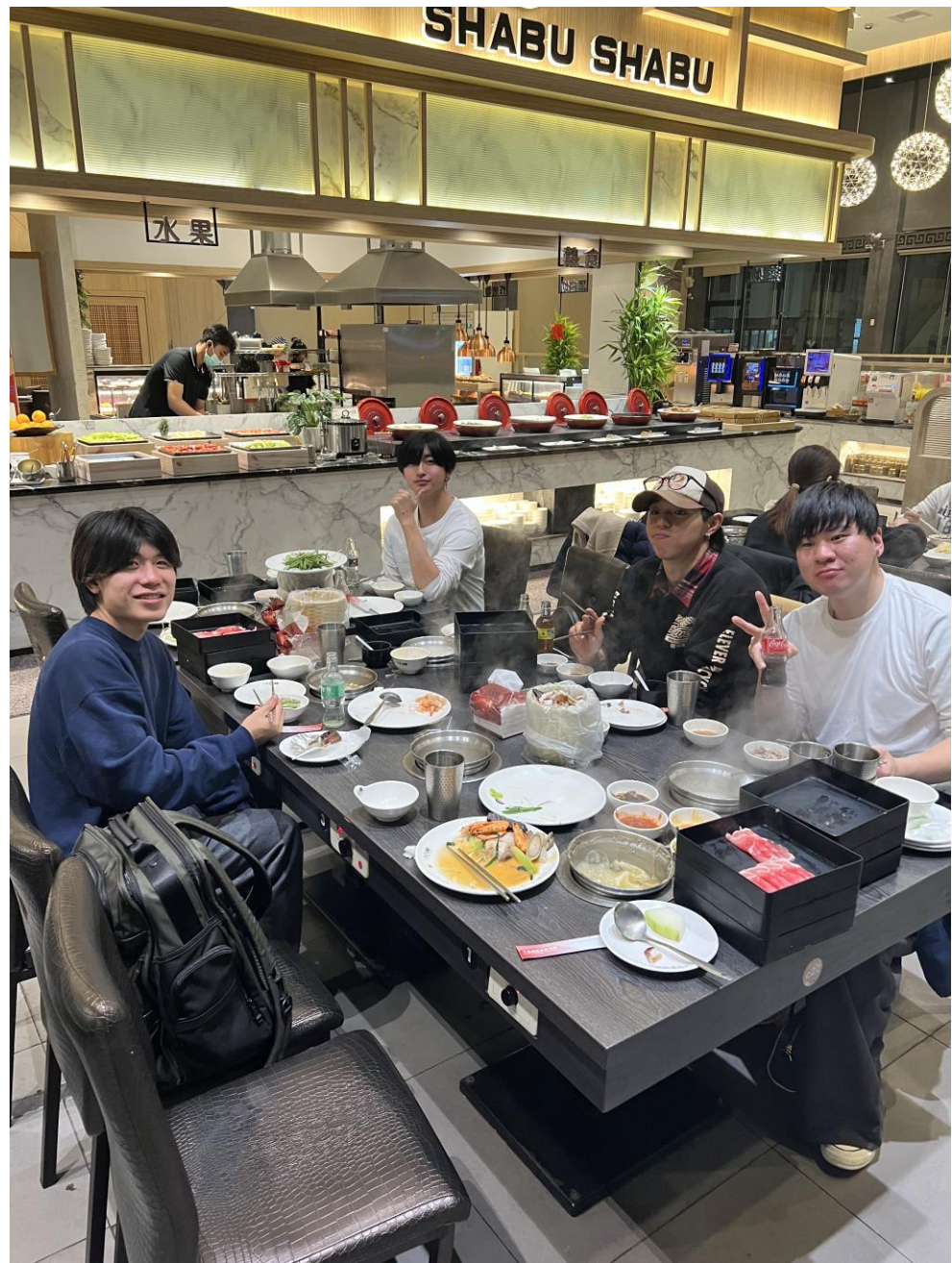
新竹市のレストランで夕食(2月19日)