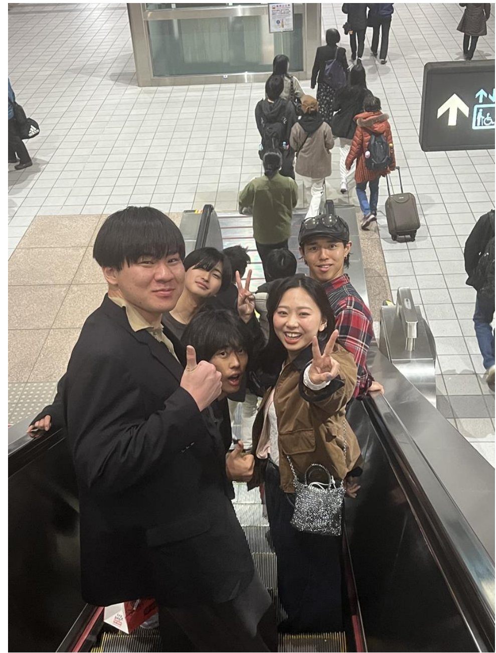
台北到着初日（2月17日）に電車で109ビルに向かう。