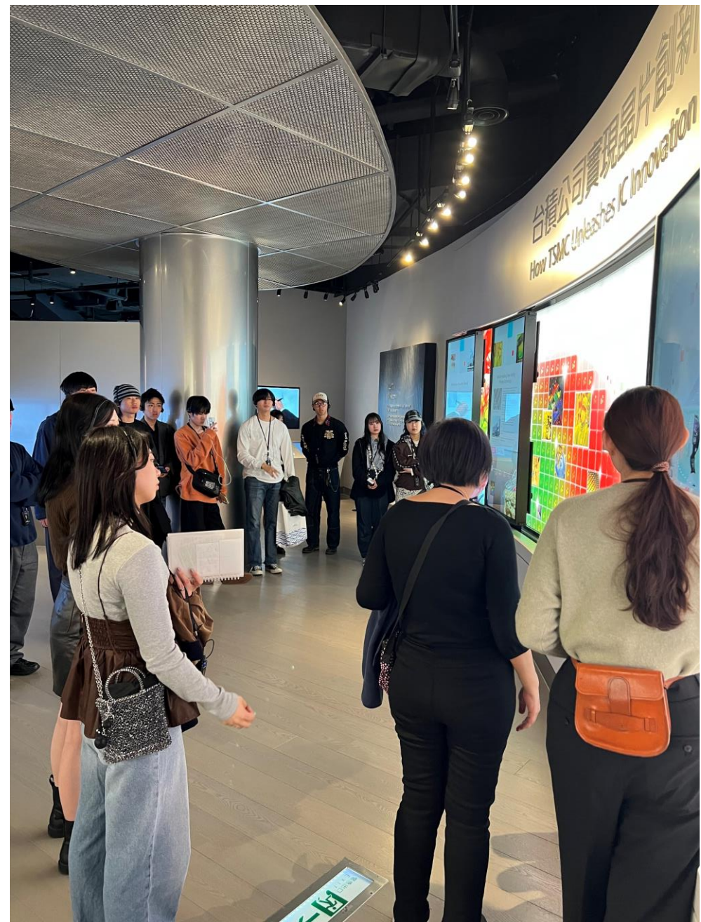
新竹市にあるTSMCイノベーションミュージアム見学（2月19日）