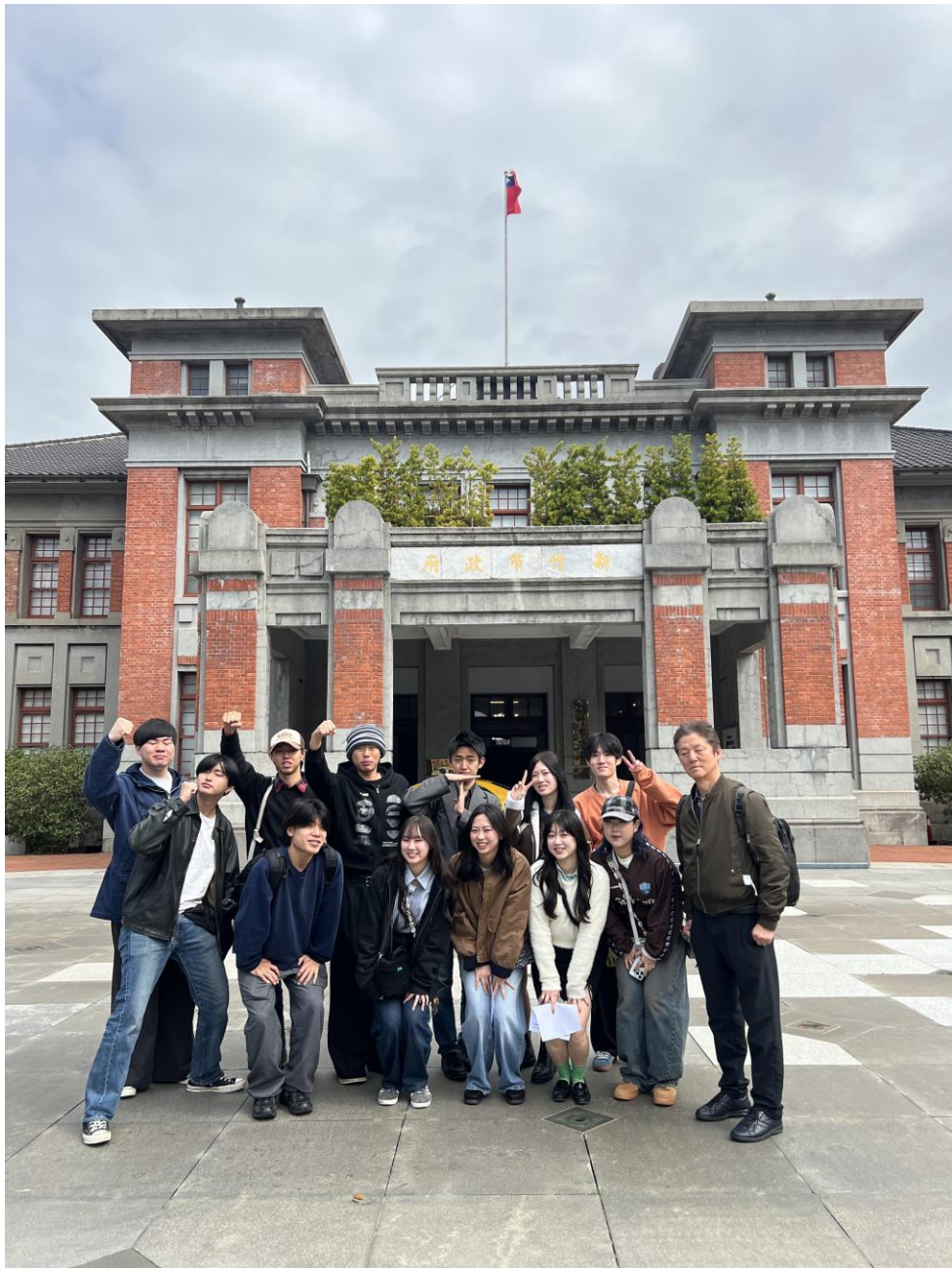
新竹市庁舎見学(2月19日)