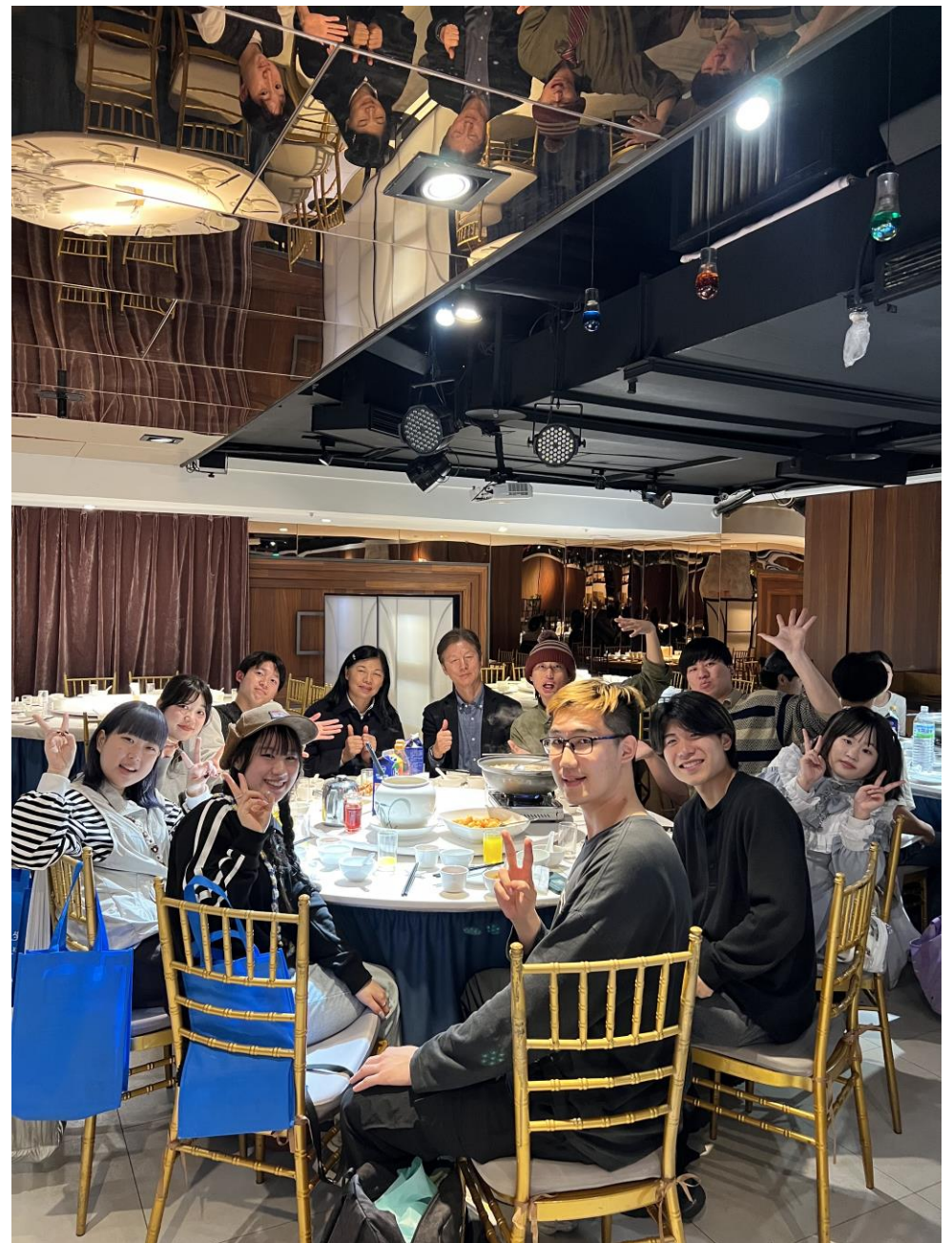
台湾真理大学で交流セミナーの後、交流会（2月20日）