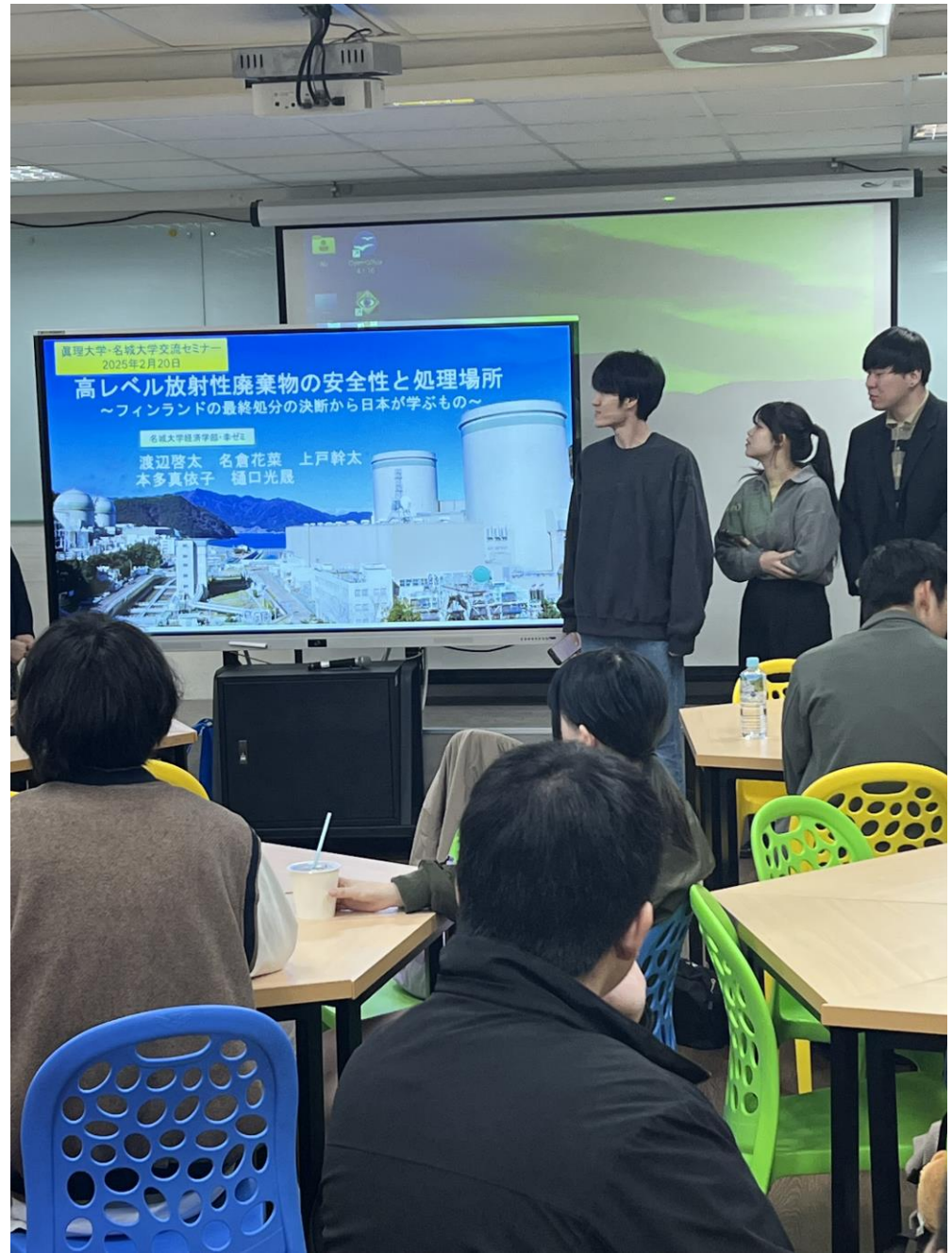
台湾真理大学で交流セミナー（2月20日）