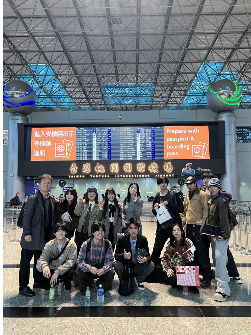
お疲れさまでした。（台北桃園空港で、2月21日）