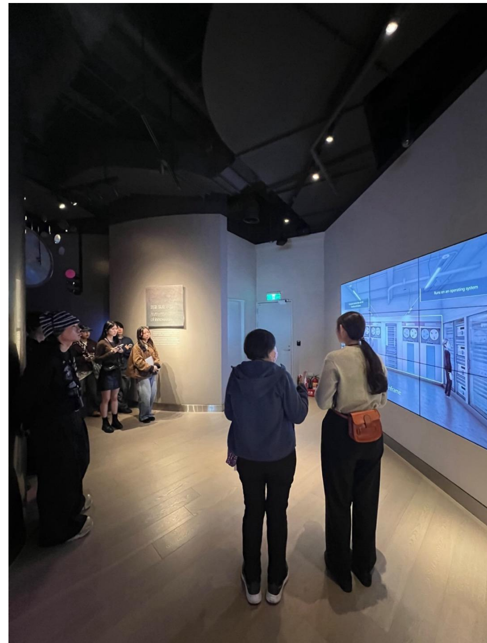
TSMCイノベーションミュージアムで半導体の役割と製造工程に関する説明（2月19日）