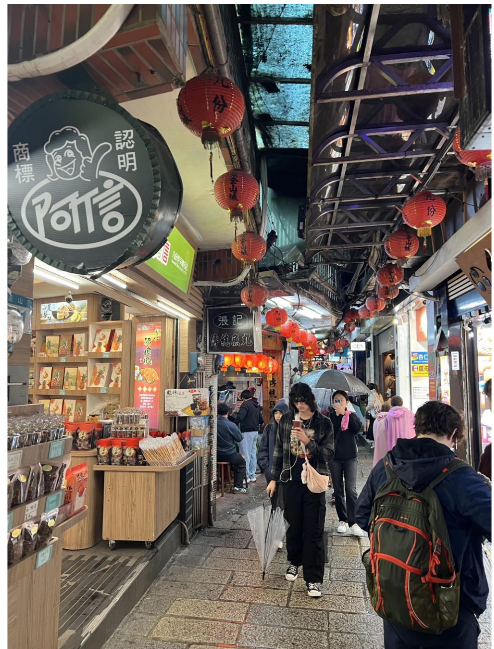
小雨の中で九份旅行（2月18日）