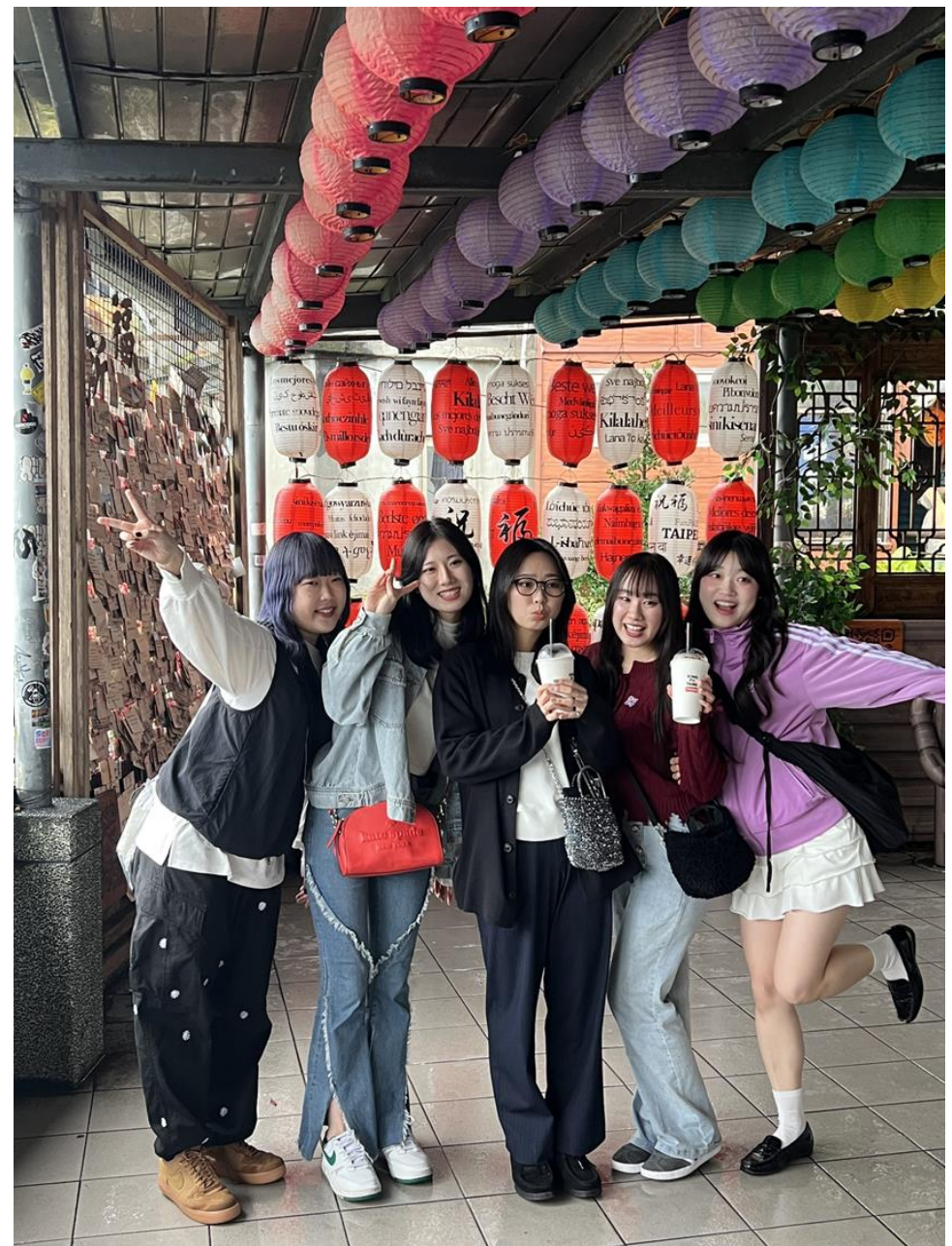
小雨の中で九份旅行（2月18日）