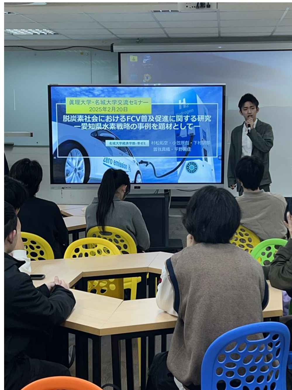
台湾真理大学で交流セミナー（2月20日）