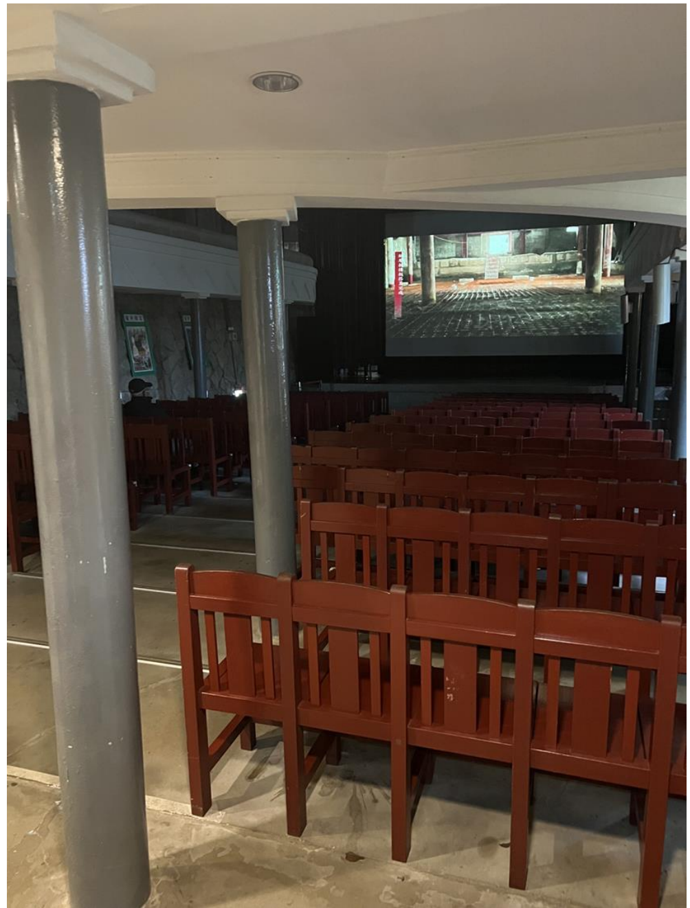
昔日本支配時代につくられた日本風の映画館で（九份、2月18日）